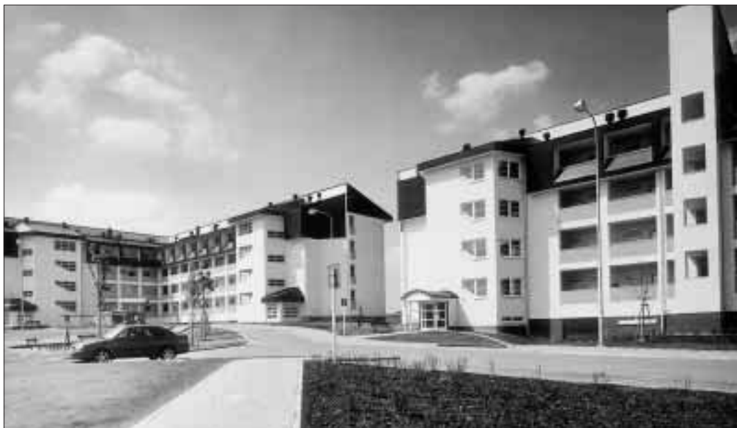
Takové domy dnes staví město Ostrava v Bělském lese.