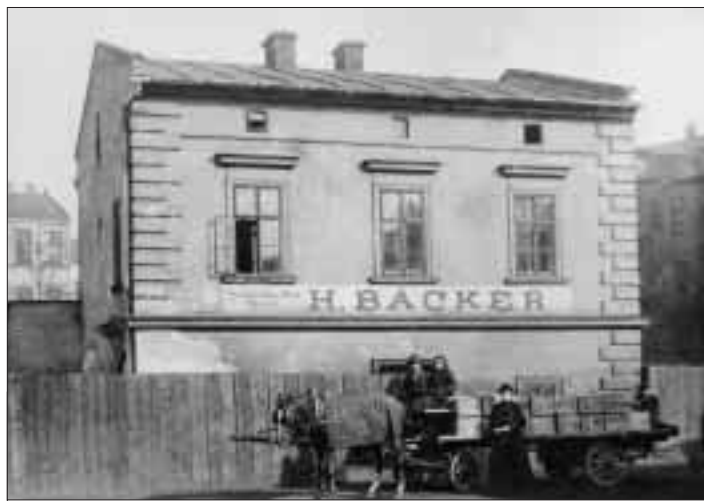
Budova obchodu s jižním ovocem, která se údajně nacházela v Moravské Ostravě.