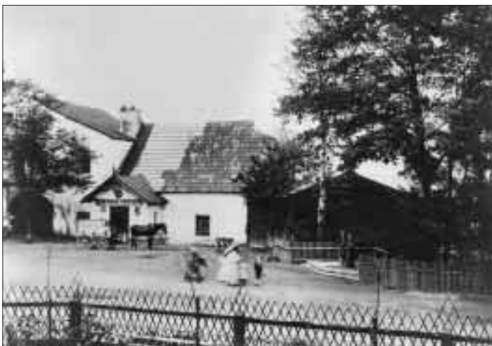
Tento hostinec stál údajně ve Vítkovicích, ale dokáže někdo přesně lokalizovat místo?

Jakékoli postřehy, údaje i vzpomínky vztahující se k těmto objektům můžete sdělit osobně i písemně na adrese: Archiv města Ostravy, Špálova 23, Ostrava-Přívoz, tel. č. 613 67 50 nebo 613 67 47 . (Maj)