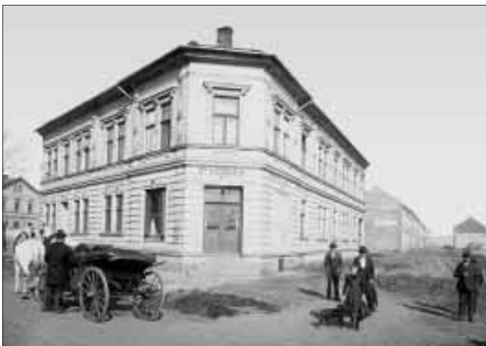
Je to opravdu restaurace?