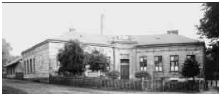
Toto je obecná škola, ale ve které části města stála?