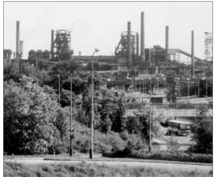
Léta diskutovaný, dávno uzavřený areál vysokých pecí Vítkovic i sousedního bývalého Dolu Hlubina je ideálním místem pro vybudování průmyslového skanzenu. Cizinci jej obdivují, mnozí Ostravané si však myslí, že jen hyzdí město. Jaká bude jeho budoucnost?

O nápadů u nás není nouze, je toho však dost, co musíme v jednotlivých regionech vybudovat především ve vztazích jednotlivých subjektů, abychom se jako atraktivní celek byli vůbec schopni prodat turistům. (k)