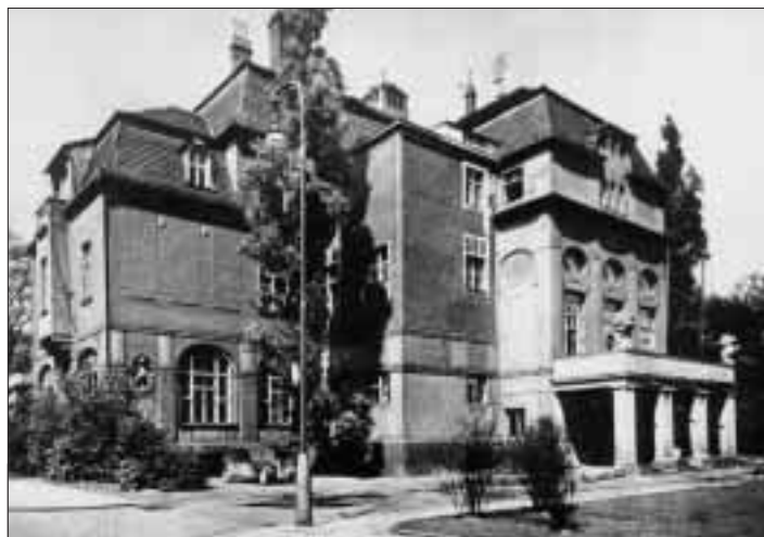
Zřejmě se jedná o veřejnou budovu ve Slezské Ostravě, možná to byl úřad nebo škola.