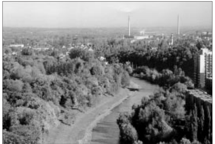
Neobyčejný pohled na Ostravu se naskytá z vyhlídkové věže radnice města Ostravy.

ho kraje je v několika jazycích připravovaná image publikace s názvem Severní Morava a Slezsko - turistický region k objevování. Na základě grantu uděleného Českou centrálou pro cestovní ruch její vydání připravuje Agentura pro regionální rozvoj, a. s., Ostrava a kromě již zmíněných šesti okresů, které budou tvořit Ostravský kraj, se na něm podílejí také okresy Jeseník, Šumperk a Vsetín. Tedy další, které mají turistům co nabídnout. Snad se Ostravsko a celý severomoravský region přece jen dočká rozvoje turistiky. (ok)