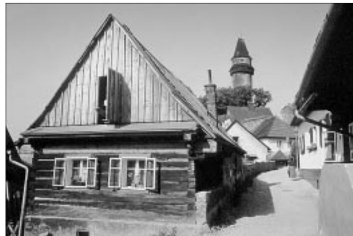
Městečko Štramberk se známou Trůbou je dobrým cílem výšlapu v kteroukoli roční dobu.

a restauracemi. Po červené značce dojdeme do nedaleké Kopřivnice, kde rozhodně o atrakce není nouze. V polovině minulého století tu byla zavedena výroba kočárů, na ni navázala výroba automobilů. Přímo v centru