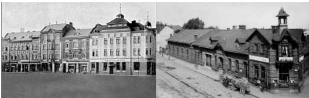
Pohled na známé Mariánské náměstí, jak vypadalo ve druhém desetiletí 20. stol. Ve druhém domě zleva měla své sídlo tehdejší

✓ nedílná součást obvodu - osada Bedříška - získala své pojmenování od dolu Bedřich? V roce 1902 došlo při hloubení větrné jámy k průvalu vody a po nesčetných a bohužel neúspěšných pokusech o odvodnění byly veškeré práce v roce 1910 zastaveny?