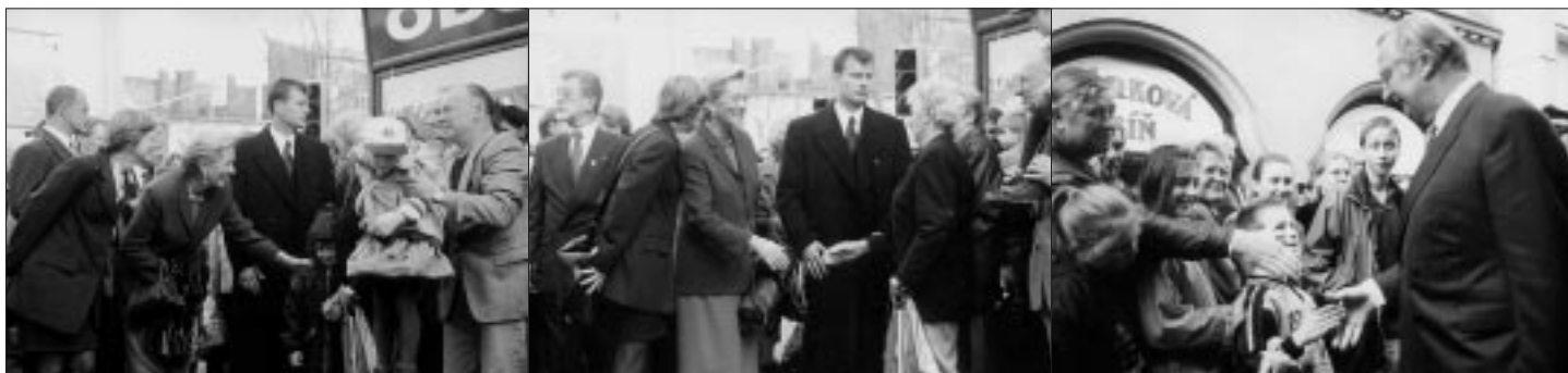
Král Albert II. a Královna Paola se vítají s občany Ostravy během své procházky městem.