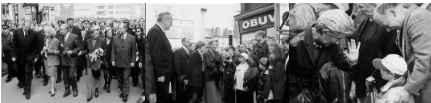
Královský pár si svou bezprostředností a vřídlostí získal každého, kdo měl tu čest se s ním setkat.

Během přípitku před slavnostním obědem dal Jeho Veličenstvo Král Albert II. najevo své sympatie k městu Ostravě a připomenul i pozitivně vnímané ohlasy na nedávné Investment Forum Ostrava 2000.