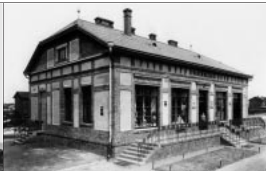
Tržnice v Hulvákách byla postavena vítkovickými železárnami v kolonii v blízkosti nové ocelárny a válcovny. (vpravo)