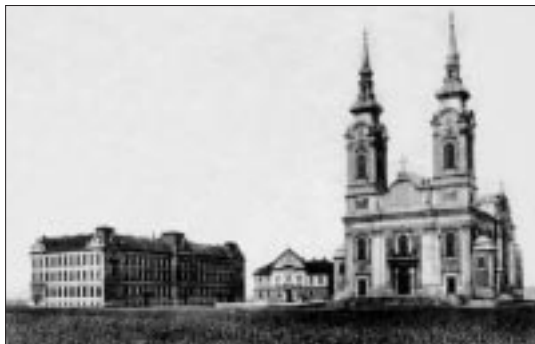
Dominantu dnešního Stojanova náměstí tvoří kostel Panny Marie z roku 1908. V jeho blízkosti byla na Podlahově ulici vybudována měšťánská a obchodní škola. (vlevo)